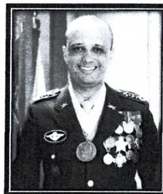
Foto de 2015. Despedida EB.

Major da reserva não remunerada do Exército. Advogado. Consultor Legislativo (concurado) da Câmara dos Deputados. Forças Especiais, Comandos, Paraquedista, Estado-Maior.