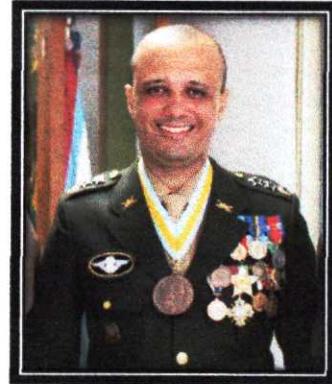
Foto de 2015. Despedida EB.

Major da reserva não remunerada do Exército. Advogado. Consultor Legislativo (concursado) da Câmara dos Deputados. Forças Especiais, Comandos, Paraquedista, Estado-Maior.